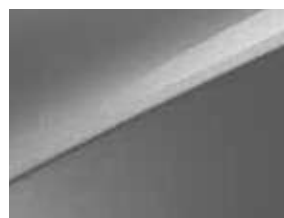
Gris Acier (KCS) (3)