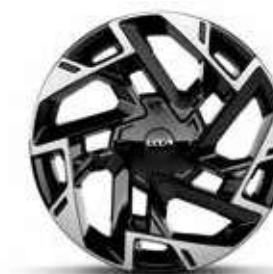
Jantes en alliage 19" GT-line Premium (Essence, Diesel & Hybride Rechargeable)

Modèle présenté : Nouveau Kia Sportage Hybride GT-line Premium.