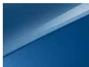
Bleu Fusion (B3L)