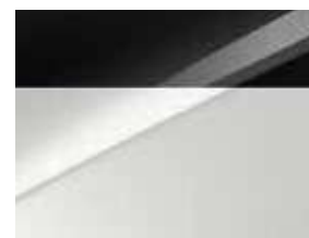
Blanc Sensation / Toit Noir (HA2) (1)

(disponible en option uniquement sur la finition GT-line Premium)