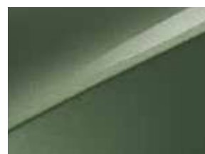
Vert Bornéo (EXG)