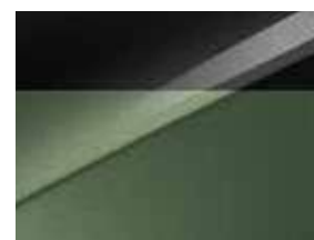
Vert Bornéo / Toit Noir (HBC)