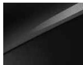
Noir Basalte (1K)