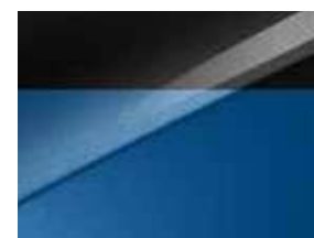
Bleu Fusion / Toit Noir (HA8)