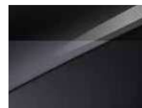
Gris Eclipse / Toit Noir (HA6)