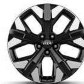
Jantes en alliage 19" Active & Design (Hybride Rechargeable)