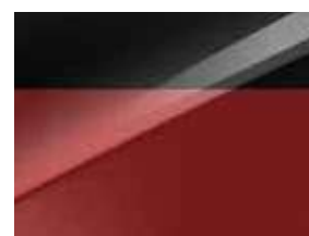
Rouge Rubis / Toit Noir (HA7)