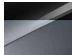
Gris Perle / Toit Noir (HA5)