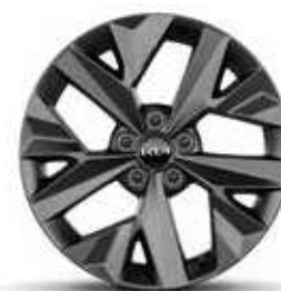
Jantes en alliage 18" GT-line Premium (Hybride)