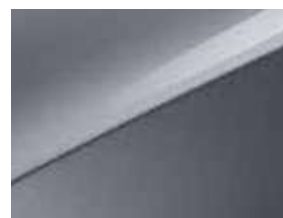
Gris Perle (CSS)