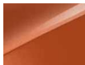
Orange Cuivre (RNG)