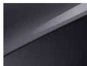
Gris Eclipse (H8G)